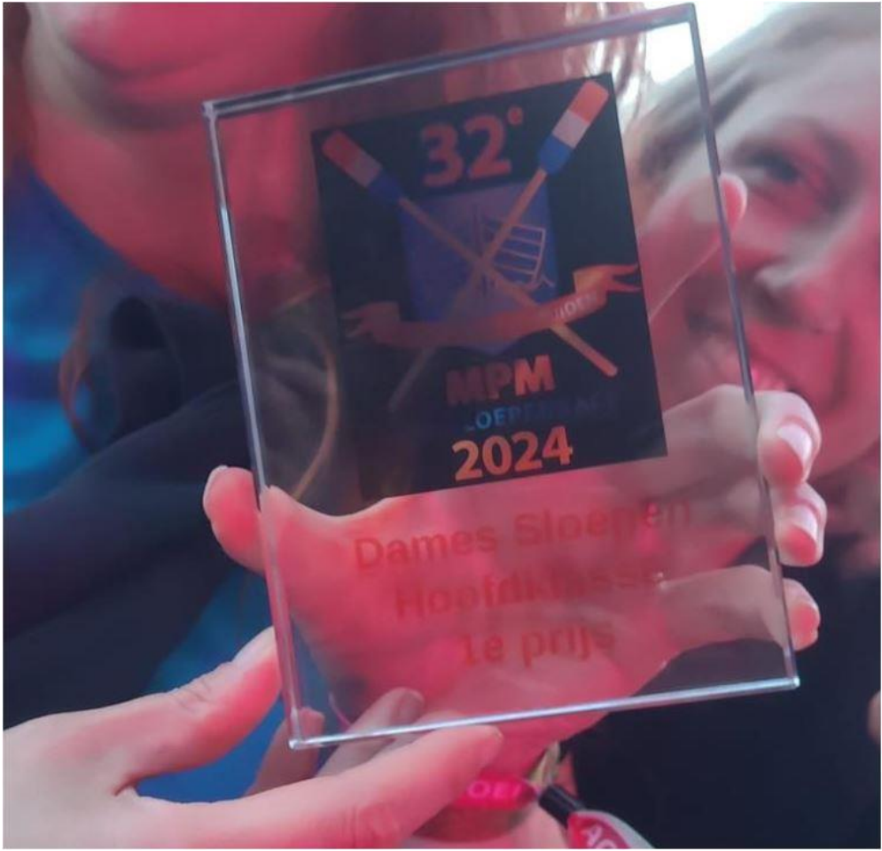
Azorean Dames: 1 e prijs in het overall klassement MPM