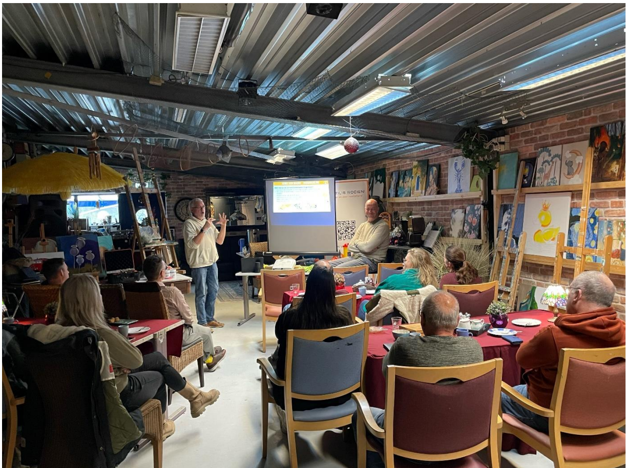
Er werd aandachtig geluisterd

Zie: https://www.veiligroeien.nl/trainingen/klassikale-trainingen-veilig-roeien/ferox-23-november-2024