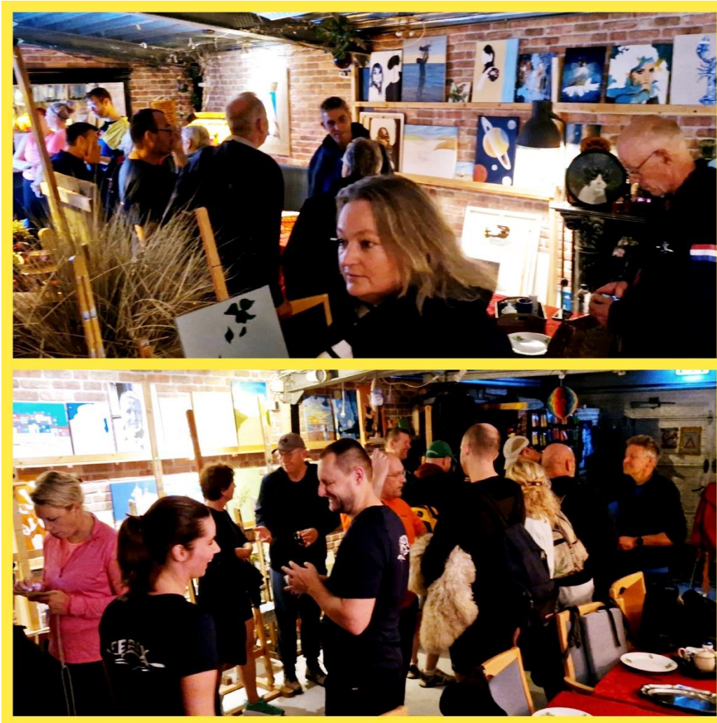
Verzamelen in het botenhuis

Rondje Leiden is eigenlijk ooit als afsluiting van het seizoen bedoeld. Tijdens het organiseren van het rondje Leiden 2024 kwamen wij er al snel achter dat als wij alle teams wilden laten meeroeien, dus veteranen, recreanten, en wedstrijdteams, dit helemaal niet haalbaar zou zijn. Tenslotte hadden wij maar plek voor 3 boten met 11 personen en 1 boot met 9 personen = 42 leden die mee konden. Wij kwamen uit op 47 aanmeldingen Hoe gingen wij dit oplossen!!