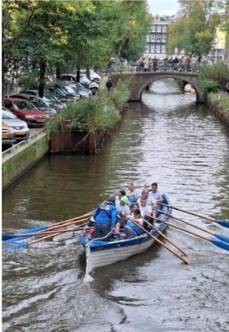
Ook de Bacchus was aanwezig in Amsterdam