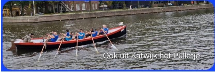
Ook uit Katwijk het Pulletje