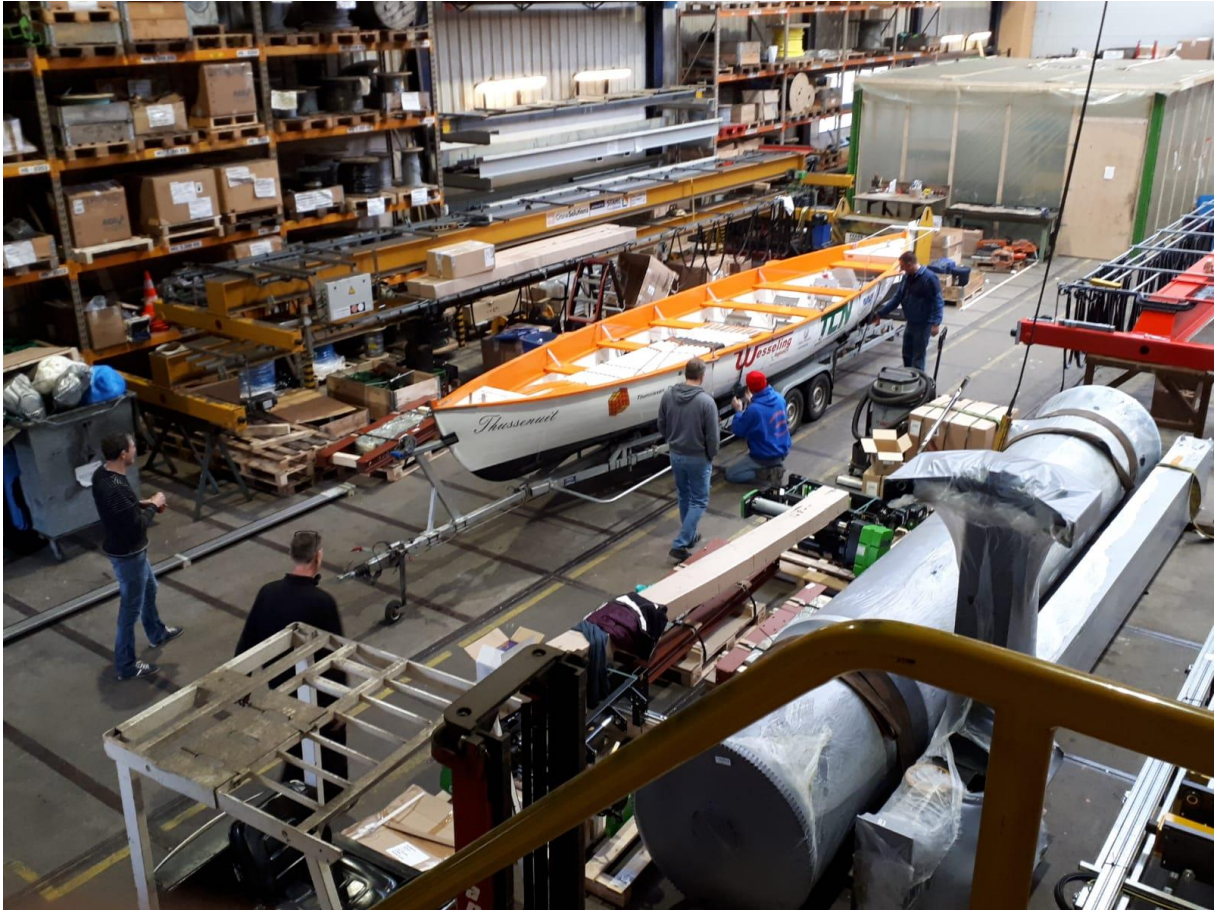
Ook de ThussenUit is weer flink onderhanden genomen