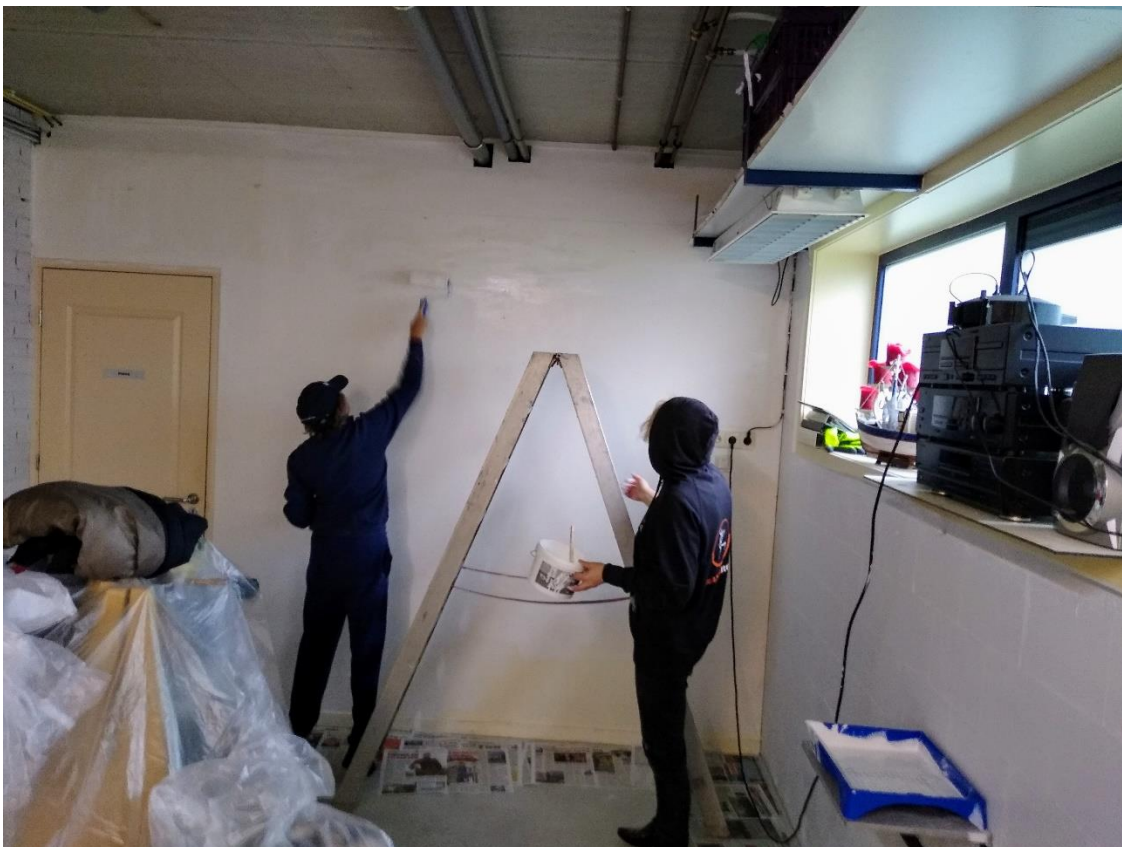
De voorstrijk wordt aangebracht